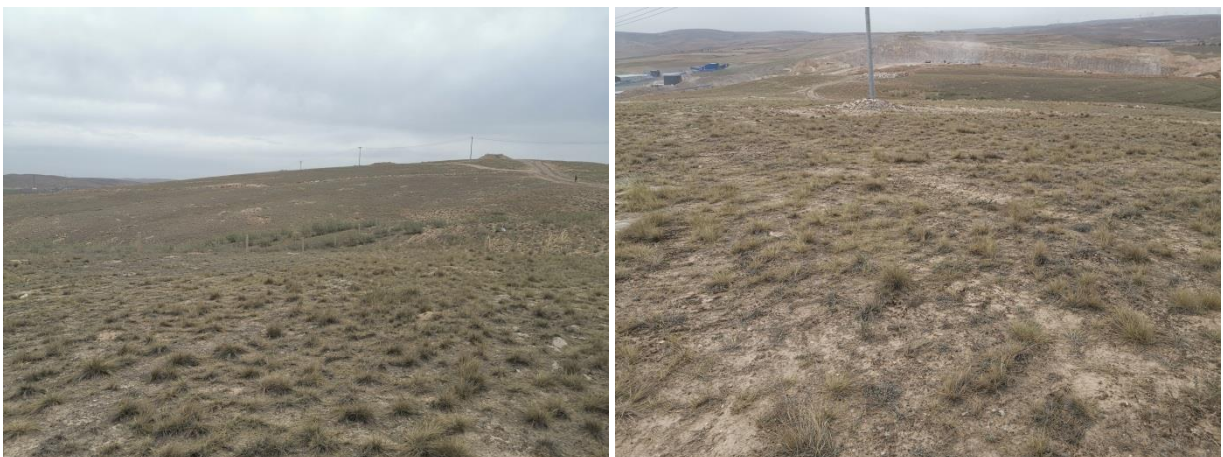
图 1-1 项目区植被

项目区植被类型主要为干旱草原植被，天然植被主要是适应当地干旱生境的灌草群落，以旱生化的植物种类为特征，长芒草、短花针茅、白草、猫头刺、狗尾草、柠条等是该区域最有代表性的植物。人工植物有杨树、旱柳、刺槐等。近年来，随着自治区实施封山禁牧，该区域天然草场植被得到了有效恢复，林草覆盖率在 30%左右。